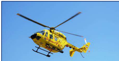
پرواز هلیکوپتر آمبولانس اورژانس پیش بیمارستانی برای نجات جان مصدوم ناشی از تصادف موتورسیکلت ۱۴۰۲/۰۳/۱۶