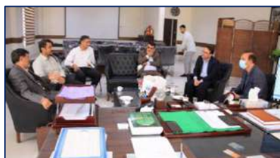
جلسه مشترک با شهردار گرمسار در خصوص برنامه طرح پزشکی خانواده برگزار شد ۱۴۰۲/۰۳/۰۸