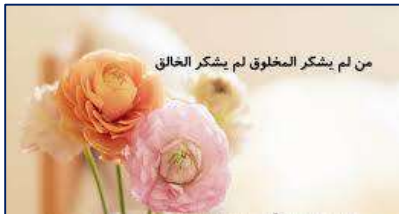
تقدیر بیماران ترخیص شده از پزشکان و کارکنان مرکز آموزشی پژوهشی و درمانی کوثر ۱۴۰۲/۰۳/۱۷