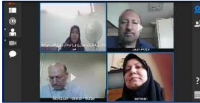
اولین وبینار شورای انضباطی منطقه ۱ کشور در سال ۱۴۰۲ ۱۴۰۲/۰۳/۰۷