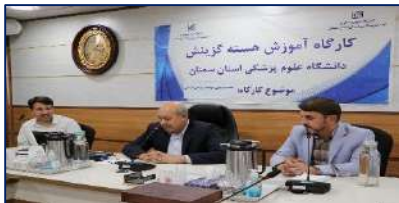
جلسه توجیهی و آموزشی گزینش دانشگاه برگزار شد ۱۴۰۲/۰۳/۲۱