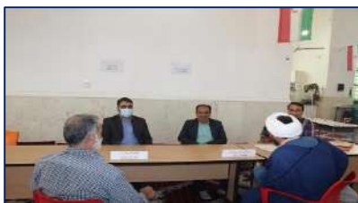
میز خدمت شبکه بهداشت و درمان در نماز جمعه دامغان ۱۴۰۲/۰۳/۲۱