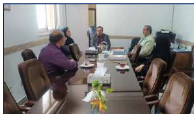
انتخاب بیمارستان امیرالمومنین (ع) سمنان به عنوان بیمارستان برتر در زمینه ترویج زایمان طبیعی ۱۴۰۲/۰۳/۳۰