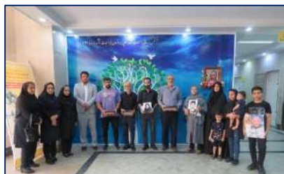
تقدیر از خانواده های سه جانبش در مرکز آموزشی پژوهشی و درمانی کوثر ۱۴۰۲/۰۳/۰۸