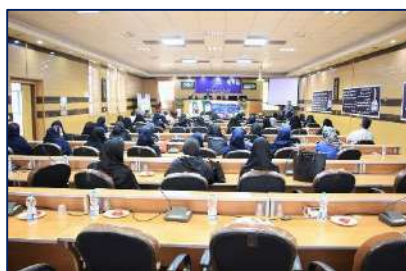
همایش جوانی جمعیت در شهرستان گرمسار برگزار شد ۱۴۰۲/۰۳/۱۶