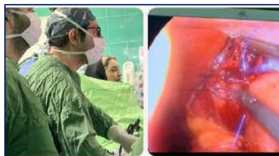
جراحی بای پس معده کلاسیک برای اولین بار در استان سمنان در بیمارستان کوثر ۱۴۰۲/۰۳/۱۶