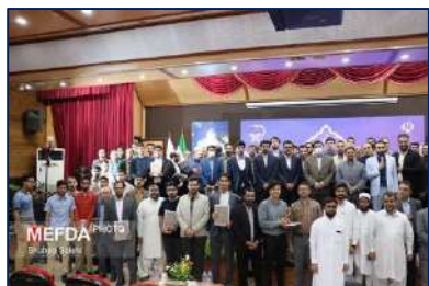
افتخار آفرینی فرهیختگان قرآنی دانشگاه در بیست و هفتمین جشنواره قرآنی هدهد وزارت بهداشت ۱۴۰۲/۰۳/۰۳