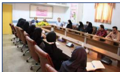
دومین جلسه هماهنگی طرح پزشکی خانواده در شهرستان گرمسار برگزار شد ۱۴۰۲/۰۳/۰۶