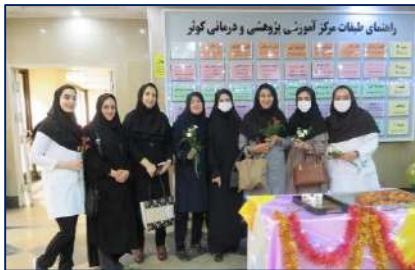
جشن روز دختر به مناسبت میلاد حضرت فاطمه معصومه (س) در مرکز آموزشی پژوهشی و درمانی کوثر ۱۴۰۲/۰۳/۰۷