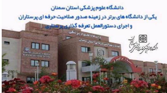
توجهات حضرت ولیعصر (عج) در جهت ارتقاء کیفیت درمان باشیم.

دانشگاه، در اجلاس روسای اداره های پرستاری دانشگاه های علوم پزشکی سراسر کشور، این دانشگاه در زمینه صدور صلاحیت حرفه ای پرستاران جزء دانشگاه برتر و در اجرای دستورالعمل تعرفه گذاری پرستاری جزء یکی از دانشگاه های پیشتاز در کشور معرفی شد. وی کسب این افتخار را خدمت جامعه پرستاری دانشگاه علوم پزشکی استان سمنان تبریک عرض نموده و آرزوی توفیقات روزافزون را از خداوند متعال مسئلت و بیان نمود: امید است در راستای حفظ و ارتقاء، همواره با همت والا و در سایه همکاری و همدلی و تحت