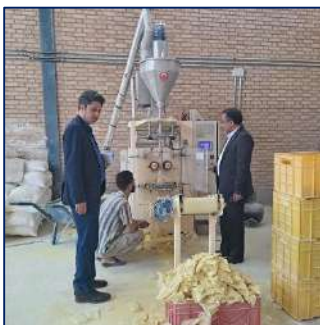
کشف و توقیف محصولات کارگاه تولید فرآورده های بهداشتی غیر مجاز در شهرک صنعتی ایوانکی ۱۴۰۲/۰۳/۰۷