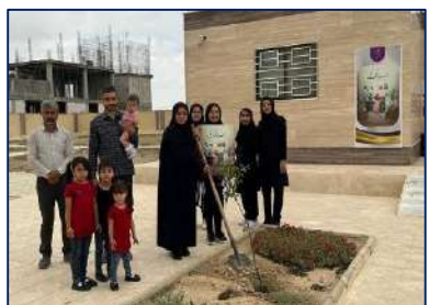
کاشت نهال به مناسبت بزرگداشت هفته ملی جمعیت در پایگاه سلامت مهر دامغان ۱۴۰۲/۰۳/۰۳