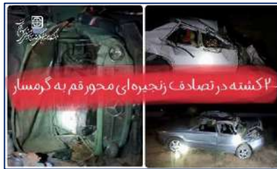
امداد رسانی اورژانس ۱۱۵ به تصادف زنجیره ای در محور قم گرمسار ۱۴۰۲/۰۳/۱۷