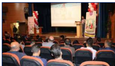
همایش بزرگداشت هفته ملی جمعیت در شهرستان سرخه برگزار شد ۱۴۰۲/۰۳/۱۰